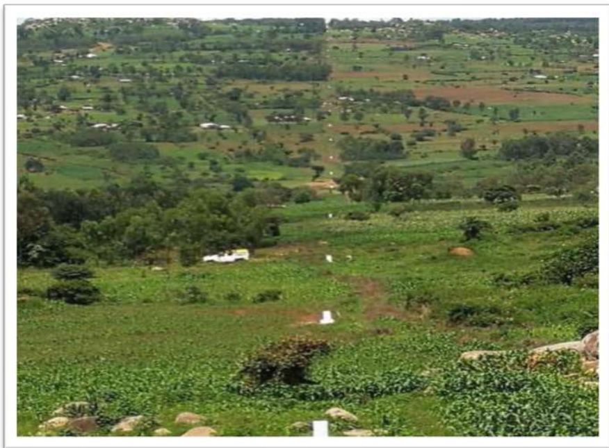
Muonekano wa mpaka wa Tanzania na Kenya eneo la Motemorabu Tarime mkoa wa Mara