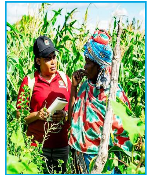
Wataalam wakipata maelezo ya wamiliki wa ardhi wakati wa upimaji wa mashamba mkoani Mbeya.