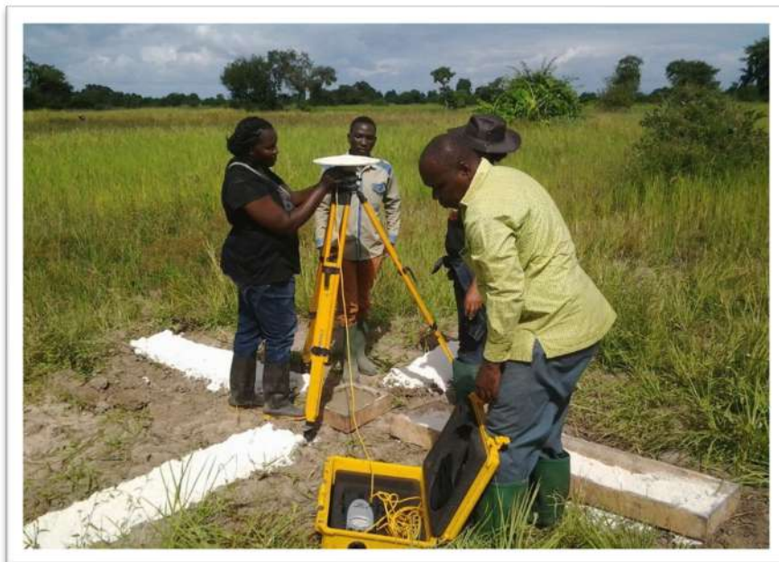
Wataalam wakiweka alama za msingi za upimaji ardhi

88. Mheshimiwa Spika , katika kupunguza muda na gharama za upimaji ardhi nchini, Wizara imekuwa ikiongeza alama za msingi za upimaji zinazotumika pamoja na mambo mengine kurahisisha upimaji wa ardhi na urasimishaji. Katika mwaka 2022/23, Wizara iliahidi kusimika alama mpya za msingi 100 katika maeneo mbalimbali nchini. Hadi kufikia tarehe 15 Mei, 2023 alama za msingi za upimaji 106 zilisimikwa katika mikoa ya Dodoma ( 13 ), Pwani ( 27 ), Iringa ( 13 ), Mbeya ( 28 ), Tanga ( 9 ), Manyara ( 4 ), Singida ( 3 ), Kagera ( 3 ), Geita ( 2 ) na Tabora ( 4 ) na hivyo kuwa na jumla ya alama za upimaji 1,041 nchini.