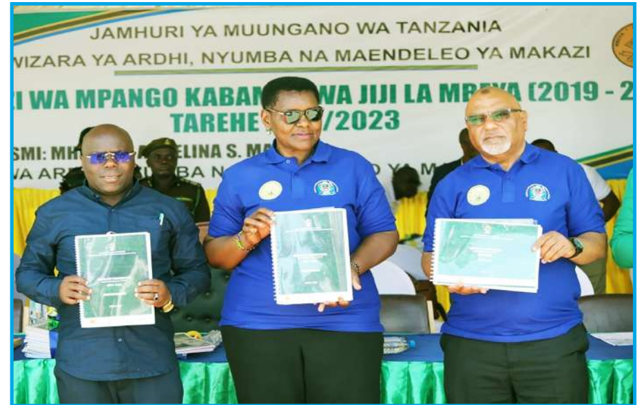
Waziri wa Ardhi Nyumba na Maendeleo ya Makazi Dkt Angeline Mabula (katikati) akiwa ameshikilia Mpango Kabambe wa jiji la Mbeya 2019-2039 baada ya kuzindua rasmi mkoani humo.