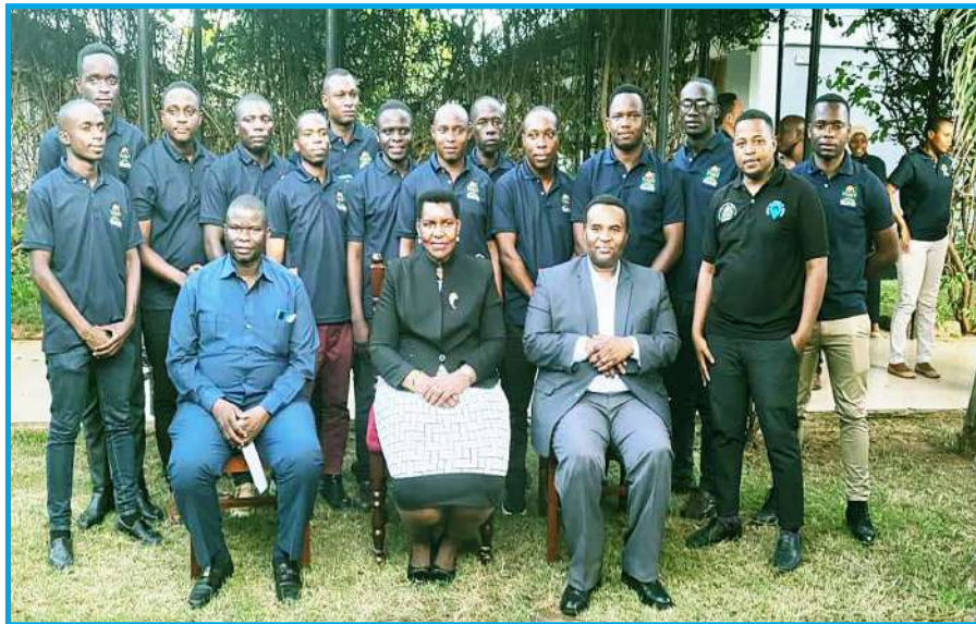
Waziri wa Ardhi Mhe. Dkt Angeline Mabula (katikati aliyekaa) akiwa katika picha na wataalam wanaohuisha kumbukumbu za wamiliki wa ardhi.