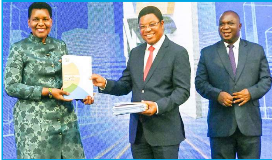
Waziri Mkuu Mhe. Kasim Majaliwa akimkabidhi kitabu cha Sera ya Ubia ya Shirika la Nyumba la Taifa (NHC) Waziri wa Ardhi Nyumba na Maendeleo ya Makazi Mhe. Dkt Angeline Mabula wakati wa uzinduzi wa Sera hiyo uliofanyika jijini Dar es Salaam.