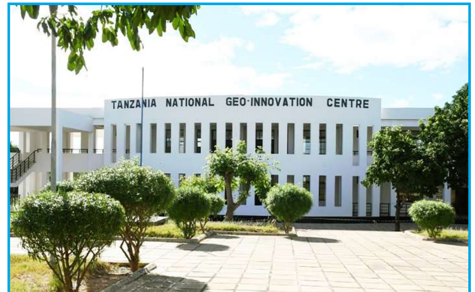
Jengo la Kituo cha Taifa cha Ubunifu na Mafunzo ya Teknolojia ya Taarifa za Kijiografia.