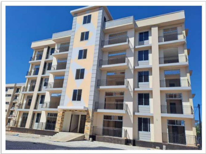
Mradi wa ujenzi wa nyumba eneo la Chamwino Dodoma

120. Mheshimiwa Spika , pamoja na ukamilishaji wa miradi iliyokuwa imesimama kwa muda mrefu, Shirika pia liliahidi kukamilisha ujenzi wa nyumba 101 katika Halmashauri ya Wilaya ya Chamwino na nyumba 303 katika Jiji la Dodoma eneo la Iyumbu kwa ajili ya kupangisha na kuuza ikiwa ni utekelezaji wa mradi wa nyumba 1,000 Jijini Dodoma. Napenda kuliarifu Bunge lako Tukufu kuwa, hadi tarehe 15 Mei, 2023, ujenzi wa nyumba 100 na jengo la maduka katika Halmashauri ya Wilaya ya Chamwino umekamilika na ujenzi wa nyumba 300 na majengo matatu ( 3 ) ya huduma za kijamii katika Jiji la Dodoma (Iyumbu) umekamilika.