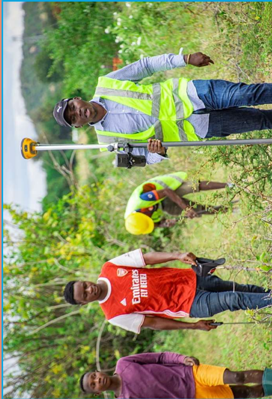
Wataalam wakiendelea na kazi ya upimaji mkoani Tanga

Mhe. Dkt. Samia Suluhu Hassan, Rais wa Jamhuri ya Muungano wa Tanzania amewezesha kukwamua miradi ya kibiashara ya Shirika la Nyumba la Taifa (NHC) iliyokwama kwa muda mrefu.