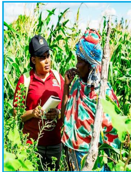
Wataalam wakipata maelezo ya wamiliki wa ardhi wakati wa upimaji wa mashamba mkoani Mbeya.