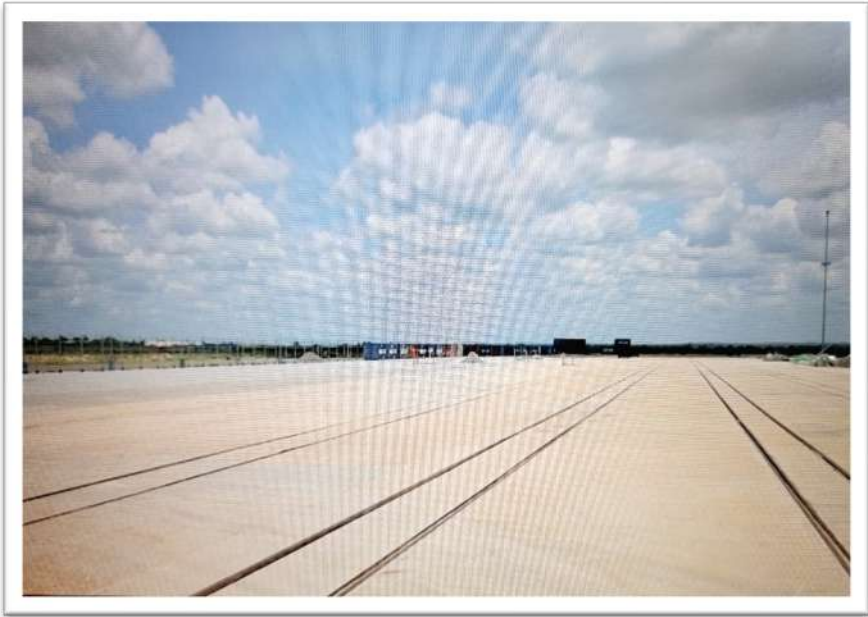
Eneo la Bandari Kavu Kwala mkoani Pwani

115. Mheshimiwa Spika , Mpango Kabambe huo unahusisha eneo lenye ukubwa wa hekta 181,130 linalojumuisha vijiji 30 vya Halmashauri za Wilaya za Kibaha ( 16 ), Chalinze ( 9 ) na Kisarawe ( 5 ). Uanzishwaji wa Jiji hilo unalenga kupata eneo kubwa zaidi la uwekezaji wa viwanda na shughuli nyingine za kiuchumi na pia kupunguza msongamano wa shughuli mbalimbali za kiuchumi katika Jiji la Dar es Salaam ikiwemo bandari ya Dar es Salaam. Kazi ya kuandaa Mpango huo inaendelea.