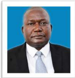
MHE. GEOPHREY MIZENGO PINDA (MB.) NAIBU WAZIRI