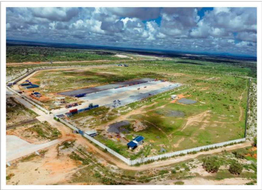
Muonekano wa eneo la Bandari Kavuu Kwala mkoani Pwani

114. Mheshimiwa Spika , Serikali inatekeleza mpango wa Kuanzisha, Kupanga na Kuendeleza Jiji la Kibiashara na Uwekezaji katika eneo la Kwala, mkoani Pwani. Katika kufanikisha Mpango huo, Wizara kwa kushirikiana na Wizara nyingine za Kisekta imeshiriki katika uandaaji wa Mpango Kabambe wa Jiji hilo.