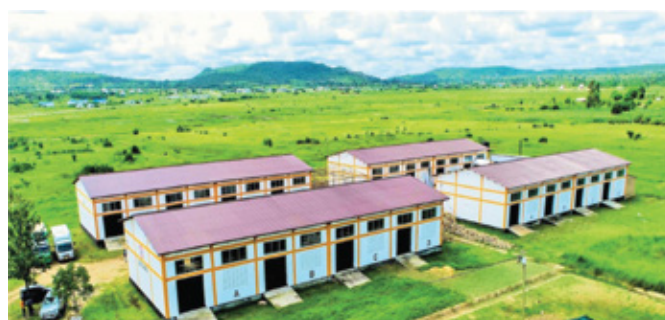
Majengo Viwanda (industrial sheds) yaliyopo Wilaya ya Chato Mkoa wa Geita

ya kurahisisha upatikanaji wa huduma kwa wazalishaji viwandani. Majengo hayo yametoa fursa za kuanzisha viwanda 523 vilivyotoa ajira 5,297.