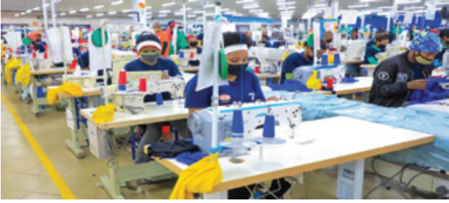
Uzalishaji wa nguo zinazotokana na pamba katika Kiwanda cha nguo cha A to Z cha mkoani Arusha.