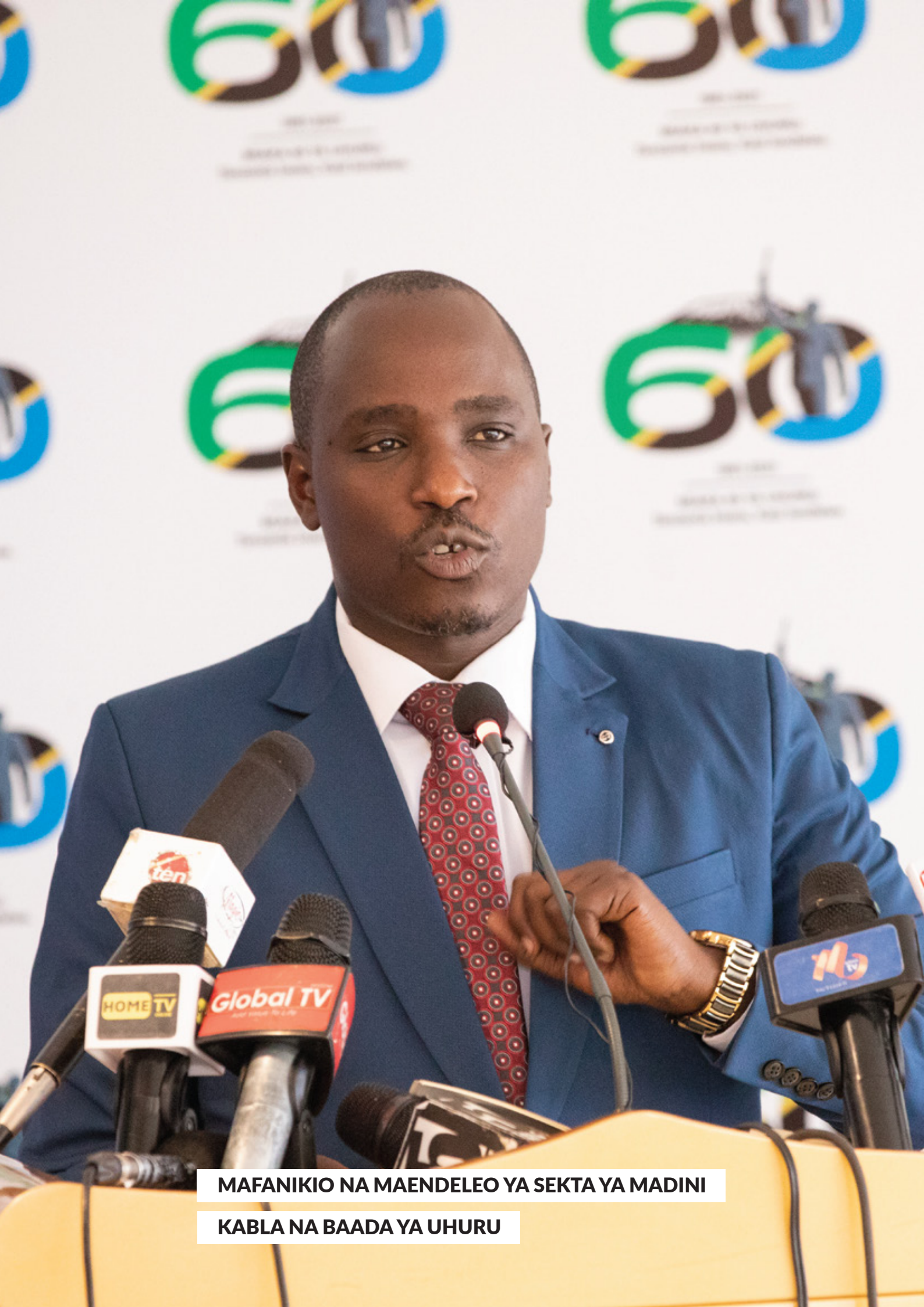
MAFANIKIO NA MAENDELEO YA SEKTA YA MADINI KABLA NA BAADA YA UHURU