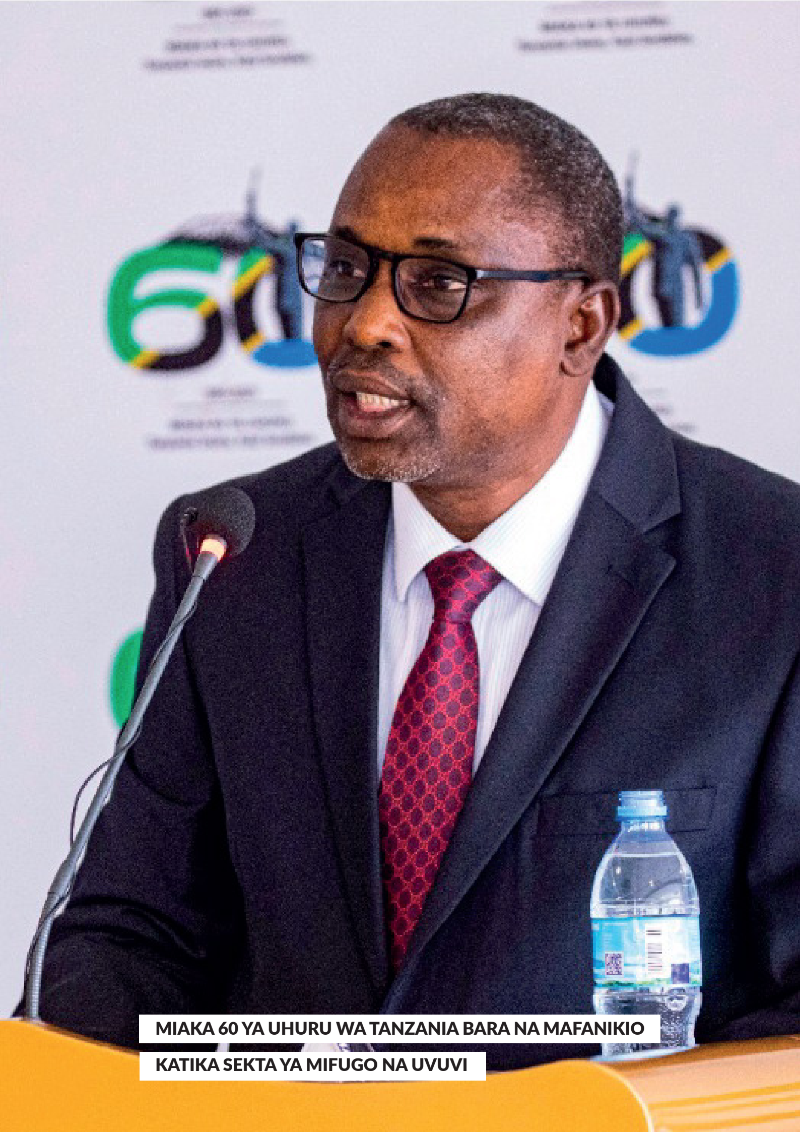
MIKA 60 YA UHURU WA TANZANIA BARA NA MAFANIKIO KATIKA SEKTA YA MIFUGO NA UVUVI