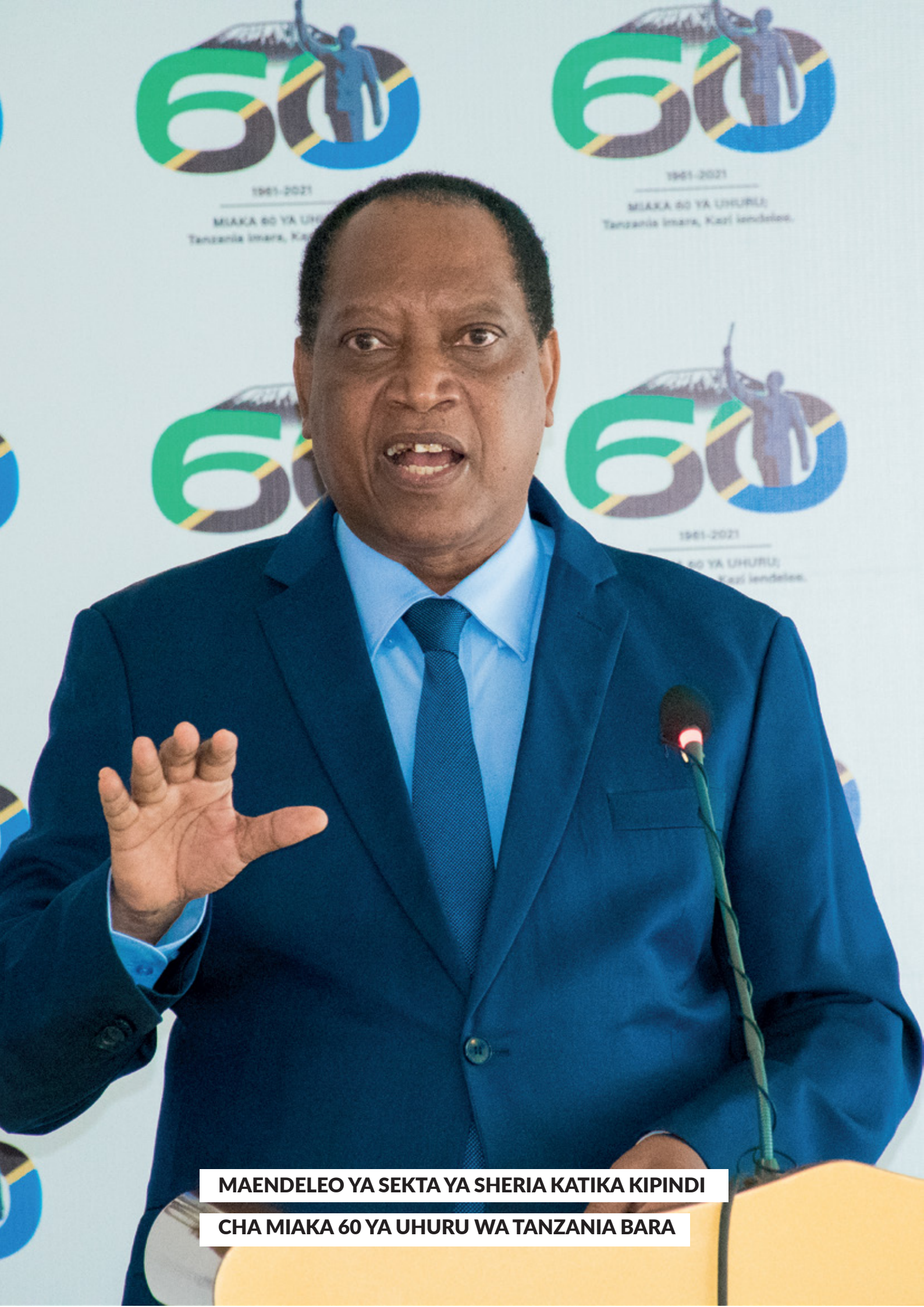
MAENDELEO YA SEKTA YA SHERIA KATIKA KIPINDI CHA MIAKA 60 YA UHURU WA TANZANIA BARA