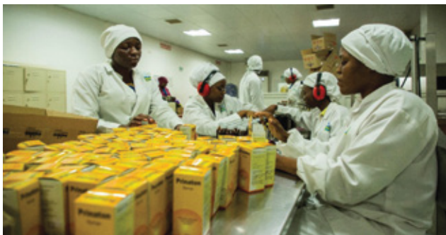
Wafanyakazi ambao hana kuwa kwenye Kiwanda cha Kilimanjaro International Leather Industries kinachojihusisha na uzalishaji wa bidhaa za ngozi, Kilimanjaro.

3.1.5.7. Viwanda vya Dawa za Binadamu na Vifaa Tiba Kutoka kiwanda kimoja cha dawa cha Mansoor Daya Chemicals Ltd kilichoanzishwa mwaka 1962 kikiwa kinatengeneza aina nne za dawa (asprin tablets, chloroquine tablets; aspirin phenacetin caffeine compound and Vitamin B complex tablets), viwanda 15 vya Dawa na Vifaa Tiba vimejengwa. Ambapo viwanda 12 vinatengeneza dawa za binadamu, viwanda 2 dawa za mifugo na kiwanda 1 kinatengeneza vifaa tiba. Kampuni za Kairuki Pharmaceutical Industries Ltd na Vista Pharmaceuticals Limited ni mojawapo ya wawekezaji wanaoendelea na ujenzi wa viwanda vya dawa na vifaa tiba.