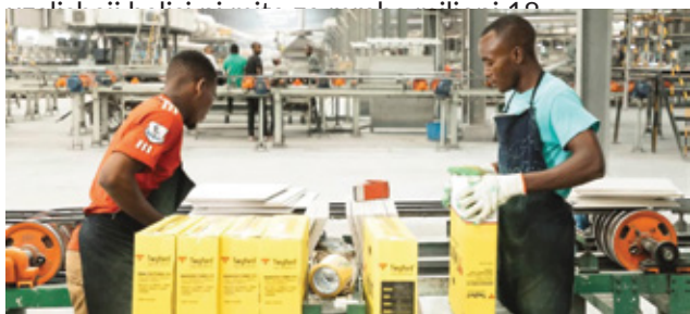
Wafanyakazi wakiwa kazini katika kiwanda cha kutengeneza marumaru Keda (T) Ceramics Company limited, Chalinze, Mkoani Pwani.

Vilevile, jitihada za Serikali za kuhamasisha uwekezaji wa viwanda zimeleta mafanikio ya ujenzi wa viwanda vikubwa viwili vya marumaru vya Goodwill (T) Ceramic Co. Ltd na KEDA (T) Ceramic Co. Ltd. Kiwanda cha Goodwill (T) Ceramic Co. Ltd kina uwezo uliosimikwa wa mita za mraba milioni 18 ambapo uzalishaji halisi ni mita za mraba Milioni 14.4. Kiwanda cha KEDA kina uwezo wa uzalishaji wa mita za mraba 28.8 ambapo