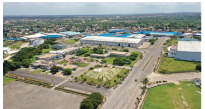
Eneo Huru la Uwekezaji kwa Mauzo Nje ya Nchi (EPZA) la Benjamin William mkapa lililopo Ubungo, Dar es salaam

Aidha, Wizara ya Viwanda na Biashara imeandaa Mwongozo wa Uwekezaji katika Mitaa ya Viwanda nchini ili kurahisisha taratibu za uwekezaji katika Mitaa ya Viwanda na kuongeza kasi ya ujenzi wa uchumi wa viwanda.