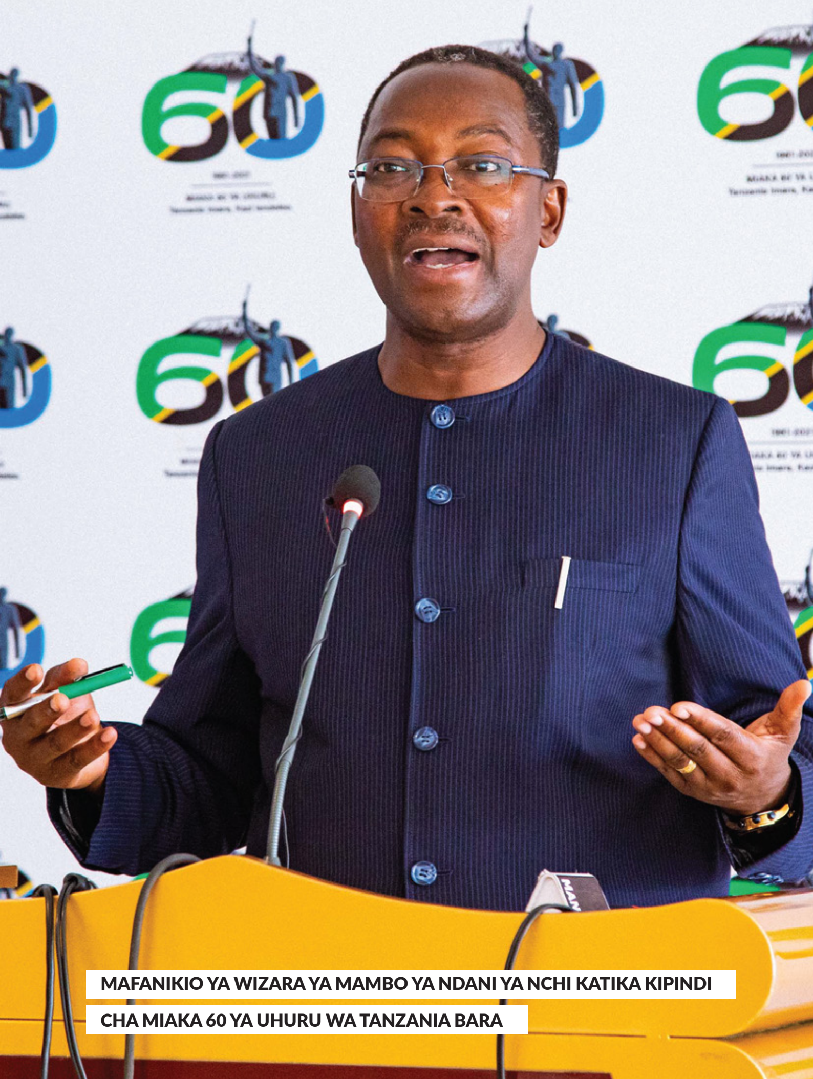
MAFANIKIO YA WIZARA YA MAMBO YA NDANI YA NCHI KATIKA KIPINDI CHA MIAKA 60 YA UHURU WA TANZANIA BARA