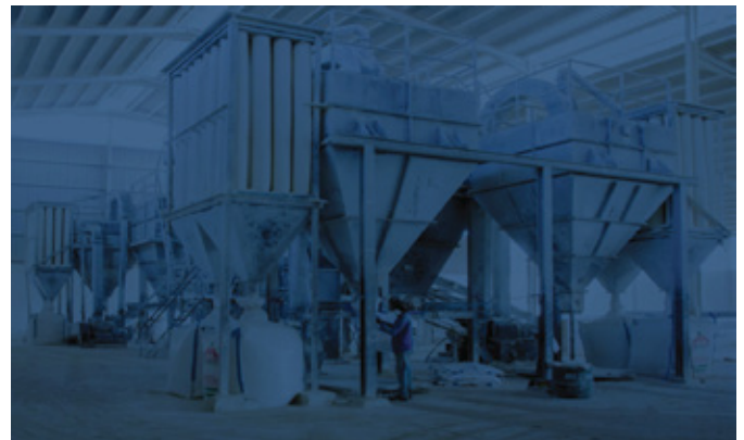
Uzalishaji wa Chokaa katika Kiwanda cha Neelkanth Lime Ltd kilichopo katika eneo la Amboni mkoani Tanga

Kwa muda mrefu Tanzania haikuwa na kiwanda kikubwa cha chokaa ambapo kwa sasa kiwanda kikubwa cha Neelkanth Lime Ltd kilichopo katika eneo la Amboni mkoani Tanga kinazalisha tani 200,000 za chokaa kwa mwaka. Viwanda vingine vya chokaa ni ARM (T) Ltd ambacho kina uwezo wa kuzalisha tani 18,000 kwa mwaka na Simba Lime Factory Ltd chenye uwezo wa kuzalisha tani 40 kwa mwaka.