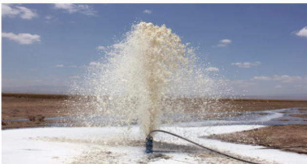
Mradi wa magadi soda katika bonde la engaruka mkoa wa Arusha.

Utekelezaji wa mradi huu wa kimkakati utawezesha upatikanaji wa malighafi za viwanda vingine kama vile viwanda vya kutengeneza vioo na sabuni. Shirika la TIRDO limekamaliza upembuzi yakiniifu (Techno-economic Study) na kubaini kuwa, mradi wa Magadi Soda Engaruka unatekelezeka kiufundi, ni endelevu kimazingira na una manufaa makubwa kiuchumi na kibiashara. Serikali inaendelea na jitihada za kutafuta mwekezaji wa kutekeleza mradi kwa kutangaza zabuni.